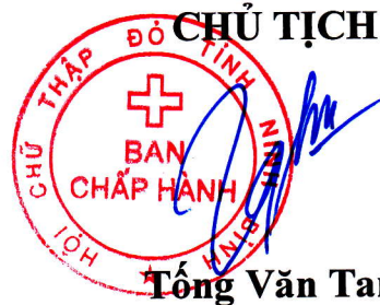
Tống Văn Tam